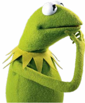
It's not easy being green