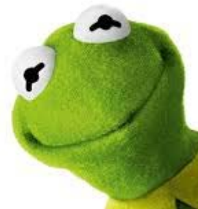
but it's all I want to be!